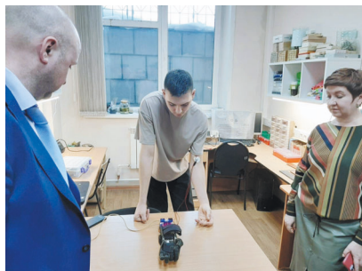
Студент НГТУ показывает разработку бионического протеза руки

верситета. Намечены три основных направления. Первое – усовершенствование медицинского симуляционного оборудования за счет расширения обучающих программ и других технических возможностей. Второе – разработка информационных технологий (ИТ) для практической медицины, направленных на оптимизацию рутинной бумажной работы врача: например, голосо-