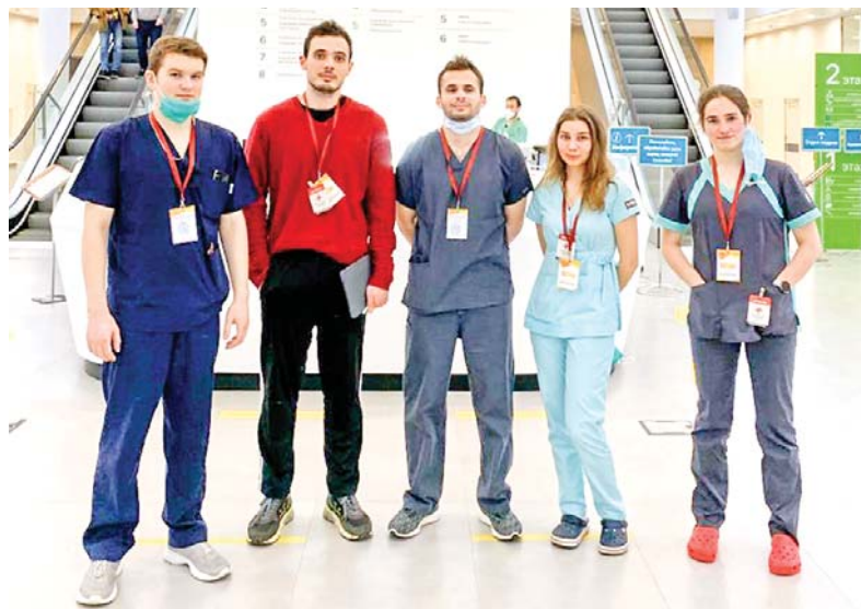
Добровольцы готовы к предупреждению распространения коронавируса