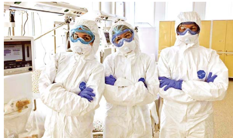
Студенты в ГКБ № 40

– Проводите ли аналитическую работу по изучению ситуации, накапливаете материалы для будущих публикаций и научных работ? Изучаете ли, например, психологическое состояние пожилых людей, на длительный срок