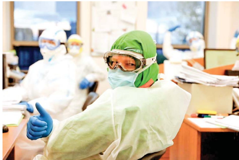
В таких нечеловеческих условиях врачи продолжают оставаться людьми

фективности защитных средств, о методах лечения COVID-19 и графиках прохождения пика эпидемии. При такой информационной какофонии немудрено, что у одной части россиян сформировалась коронафобия, а у другой – стойкое неверие в серьёзность вирусной угрозы.